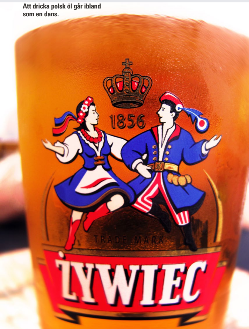
Att dricka polsk öl går ibland som en dans.