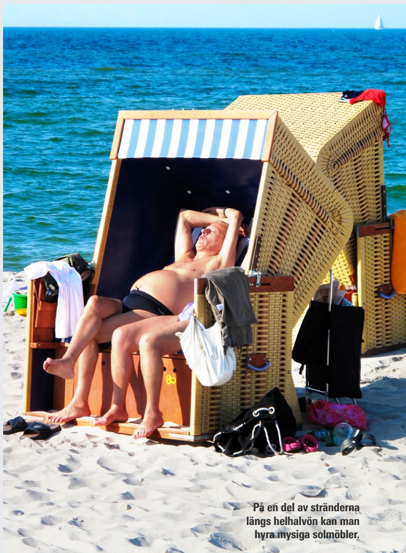
På en del av stränderna längs helhalvön kan man hyra mysiga solmöbler.